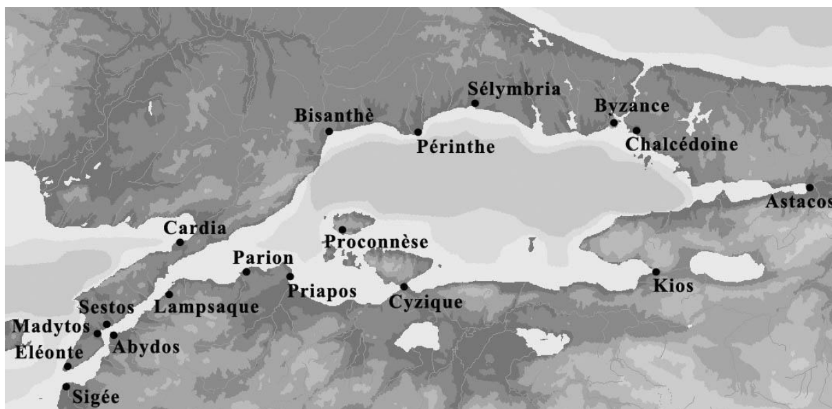
Fig. 1. Harta generală a cetăților grecești de pe țărmurile Hellespontului și ale Propontidei (apud Robu 2012, 195).